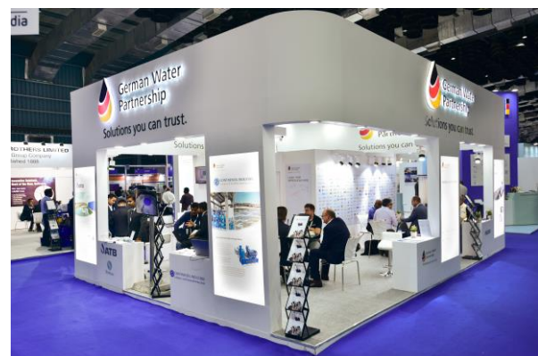
IFAT India 2018