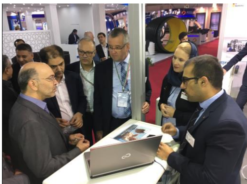
Delegation auf der WATEX 2017