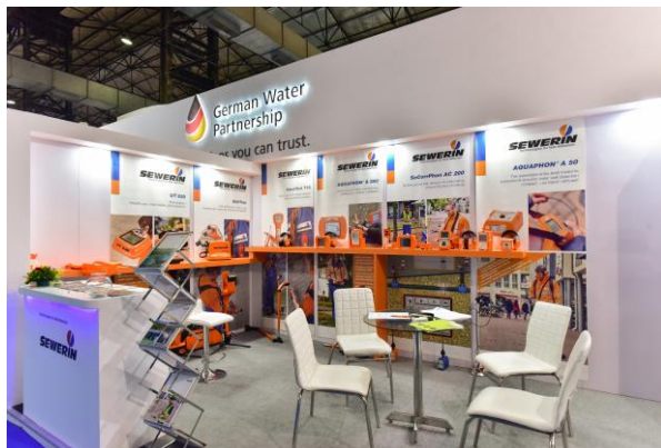
IFAT India 2017