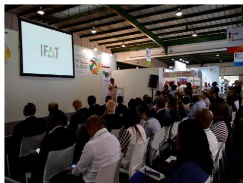
GWP-Session im Rahmen der IFAT Africa 2017