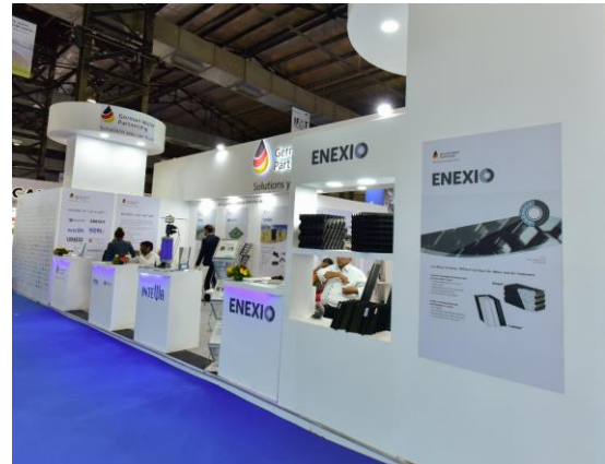
IFAT India 2017