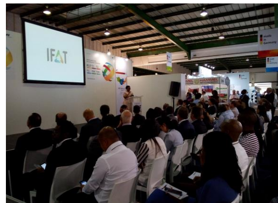
GWP-Session im Rahmen der IFAT Africa 2017